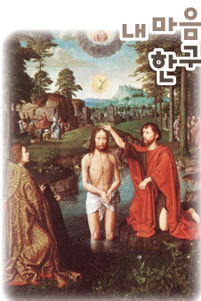
내 마음의 성경 한국절

죄 없으신 예수님께서 먼저 요한을 찾아가 세례를 청했던 것처럼, 다른 사람이 변화되기를 기다리기보다 내가 먼저 변화할 수 있도록 용기와 은총을 청하는 하루가 되기를 바랍니다.