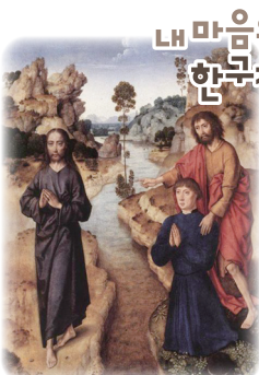
‘보라, 하느님의 어린양,’ 디르크 보우츠 작

스스로에게 이렇게 물어볼 수 있으면 좋겠습니다. “나는 요즘 무엇을 증명하려 애쓰며 살고 있는가?” 그리고 이렇게 기도하면 좋겠습니다. “주님, 제가 저 자신을 드러내기보다, 당신을 가리키는 삶을 살게 하소서.” 그 기도 안에서 우리는 조금씩, 애쓰지 않아도 되는 신앙의 자유와 평화를 배워 가게 될 것입니다.