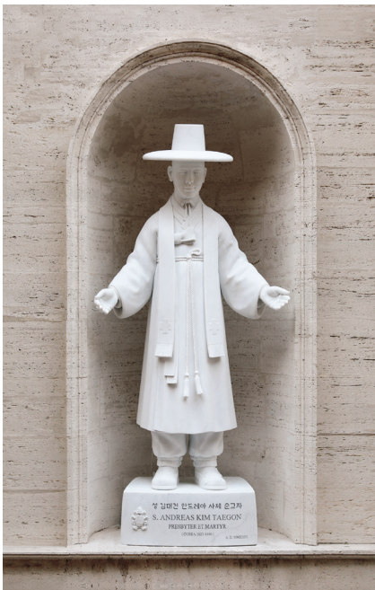
▲ <성 김대건 안드레아 신부 성상> 370x183x120cm, 대리석, 2023년