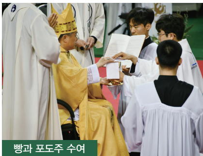
빵과 포도주 수여