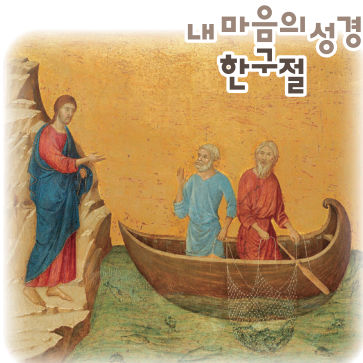
내 마음의 성경 한구절

회개는 당연히 이 후자의 삶을 의미합니다. 우리는 어떠한 모습의 신앙인으로 살아가고 있는지요? 하느님께서서는 지금 이 시간 우리에게 참된 회개를 이룰 또 한 번의 기회를 주셨습니다. 하느님께서 허락하지 않으셨다면 오늘 이 시간은 우리에게 주어지지 않았을 시간입니다. 하느님을 내 생각 안으로 끌어들이려 하지 말고, 우리가 하느님의 뜻 안으로 일치되어 가기를 다짐하며, 참된 회심을 이루려 노력하는 그런 오늘을 살아갈 수 있었으면 좋겠습니다.