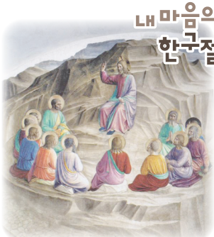
내 마음의 성경 한구절

2026년 새해의 시작을 지나 사순 시기를 앞둔 지금, 예수님은 우리 각자의 삶이라는 ‘산’ 위에서 말씀하십니다. “사랑하는 딸아, 아들아. 세상의 잣대로 너 자신을 불행하다고 낙인찍지 마라. 네가 울고 있을 때 내가 곁에 있고, 네가 가난할 때 내가 너의 전부가 되어 주마.” 이번 한 주간, 나의 부족함과 고통을 불행의 증거가 아니라 하느님이 들어오실 자리로 봉헌해 봅시다. 그리고 내가 먼저 자비롭고, 먼저 평화를 심는 사람이 될 때, 하느님만이 주시는 기쁨이 우리 마음속에 조용히 자리 잡을 것입니다. 행복은 멀리 있지 않습니다. 나를 향해 시선을 놓지 않으시는 주님을 바라보는 그 순간에 이미 참행복은 시작되었습니다. 아멘.