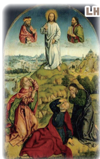
내 마음의 성경 한구절

우리의 주님은 넘어져 희망이 없는 것처럼 절망하고 있는 지금의 내 손을 잡아주시면서 희망찬 목소리로 말씀하시고 계십니다. “일어나라. 그리고 두려워하지 마라”(마태 17,7).